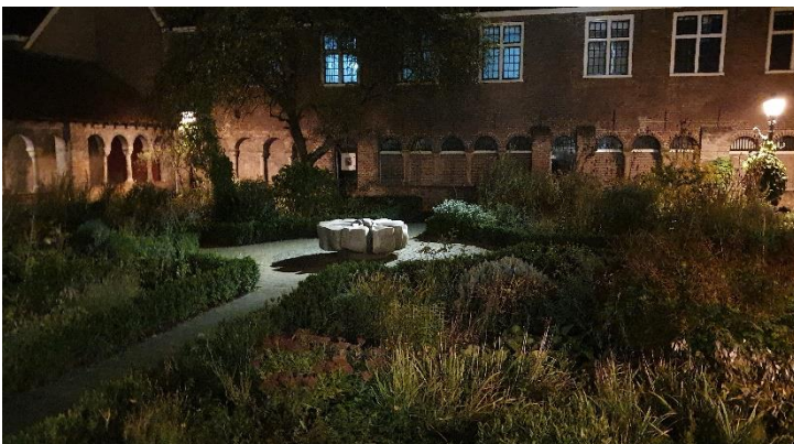
Avond in de Pandhof - Romantische verlichting vanachter het nieuwe hekwerk

Deze expositie is tussen 31 mei en 22 juni gratis te bezoeken, ma t/m vrij 8.30–17.00 uur en donderdag tot 21.00 uur, in het Stadhuis, Stadhuisbrug 1. Zie ook www.aorta.nu