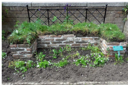
zodenbank in de Pandhof, mei 2015