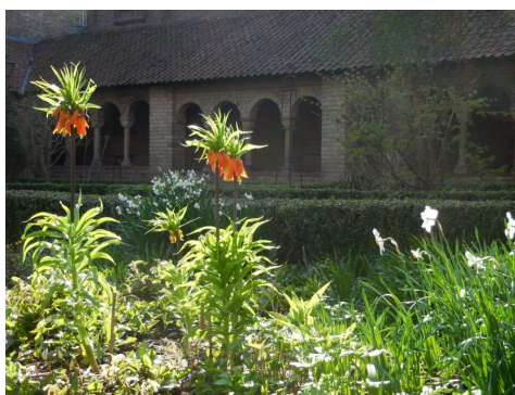
keizerskronen en dichtersnarcissen, april 2015